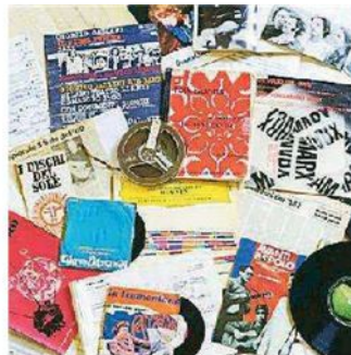
In mostra dischi e tanto altro

re in un corridoio dove gli oggetti raccolti in una decina di teche raccontano altrettanti aspetti di un momento storico. Sono istantanee di mondi apparentemente molto diversi, ma sempre collegati tra loro. Il visitatore si stupirà, ad esempio, nello scoprire l'attrazione di Paul McCartney per la musica di Luciano Berio...». La mostra sarà aperta fino al 10 novembre dal lunedì al sabato dalle 8.30 alle 19.30. Per info: www.municipio.re.it/peri_biblioteca . —