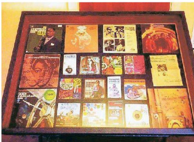
Una delle teche poste all'Istituto musicale Achille Peri

monte della realtà esterna, dove tutti gli artisti possono ritrovarsi a prescindere dai generi musicali di riferimento». La mostra sarà naturalmente visitabile in occasione dell'Open Day di domenica che avrà luogo dalle 14.30 alle 19; dalle 16 alle 18 ci saranno le visite guidate. Inoltre, dalle 18, ci saranno performance musicali intorno alla mostra; in particolare verrà proposto di Ligeti Poème symphonique per 100 metronomi (a cura di Marco Pedrazzini), mentre Claudio Piastra eseguirà di Paolo Castaldi Battente per chitarra. —