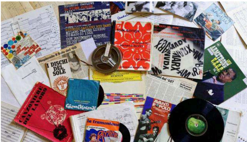
"1968-2018: Suoni in Movimento": la mostra che racconta il Sessantotto in musica

1968-2018 Suoni in Movimento, una mostra per raccontare il '68 in musica. Sabato 6 ottobre l'inaugurazione all'Istituto "Peri - Merulo" di Reggio Emilia: visite aperte fino al 10 novembre.